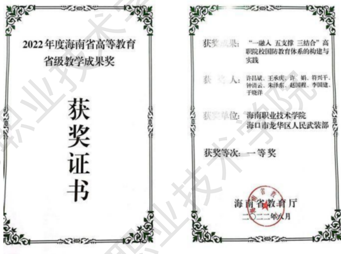
图 1-3 国防教育成果获 2022 年海南省高等教育省级教学成果一等奖

项，完成属地宣传部门委托红色旅游规划课题 1 项，2022 年荣获海南省高校教学成果奖一等奖，已申报 2022 年职业教育国家级教学成果奖。