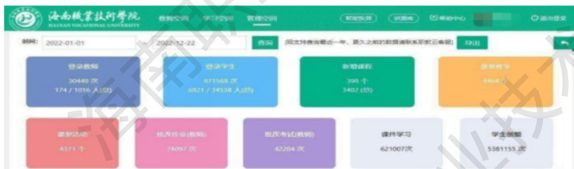
图 2-1 学校近一年智慧职教平台使用情况

教学基地，其中 1 间沉浸式互动教室、2 间信息化教室、2 间观摩与控制室、1 间拍摄室及 3 间微课制作室。教学平台方面引入了智慧职教、超星、智慧树、雨课堂等，可根据授课情况及资源情况选择教学平台及资源建设，教师可以借助国家教学资源库加上自建教学资源组合的形式建立授课课程。此外学校还持续推动以教学资源建设为基础、课程建设为核心、教师教学能力提升为保障的校本数字化教学资源建设，使教师教学理念从封闭走向开放、教学模式从单一走向多元、教学载体从平面走向立体、学生学习从被动走向主动。强化数字化教学资源应用，通过“直播+教学平台+社群”的多平台融合授课模式，实现线下到线上无缝衔接，全面应对了疫情期间线上教学问题，全方位提升师生信息素养。学校今年获得 1 门职业教育国家在线精品课程及 4 门省级高校精品在线开放课程。获得海南省第二十九届教师教育教学信息化三等奖 2 项。