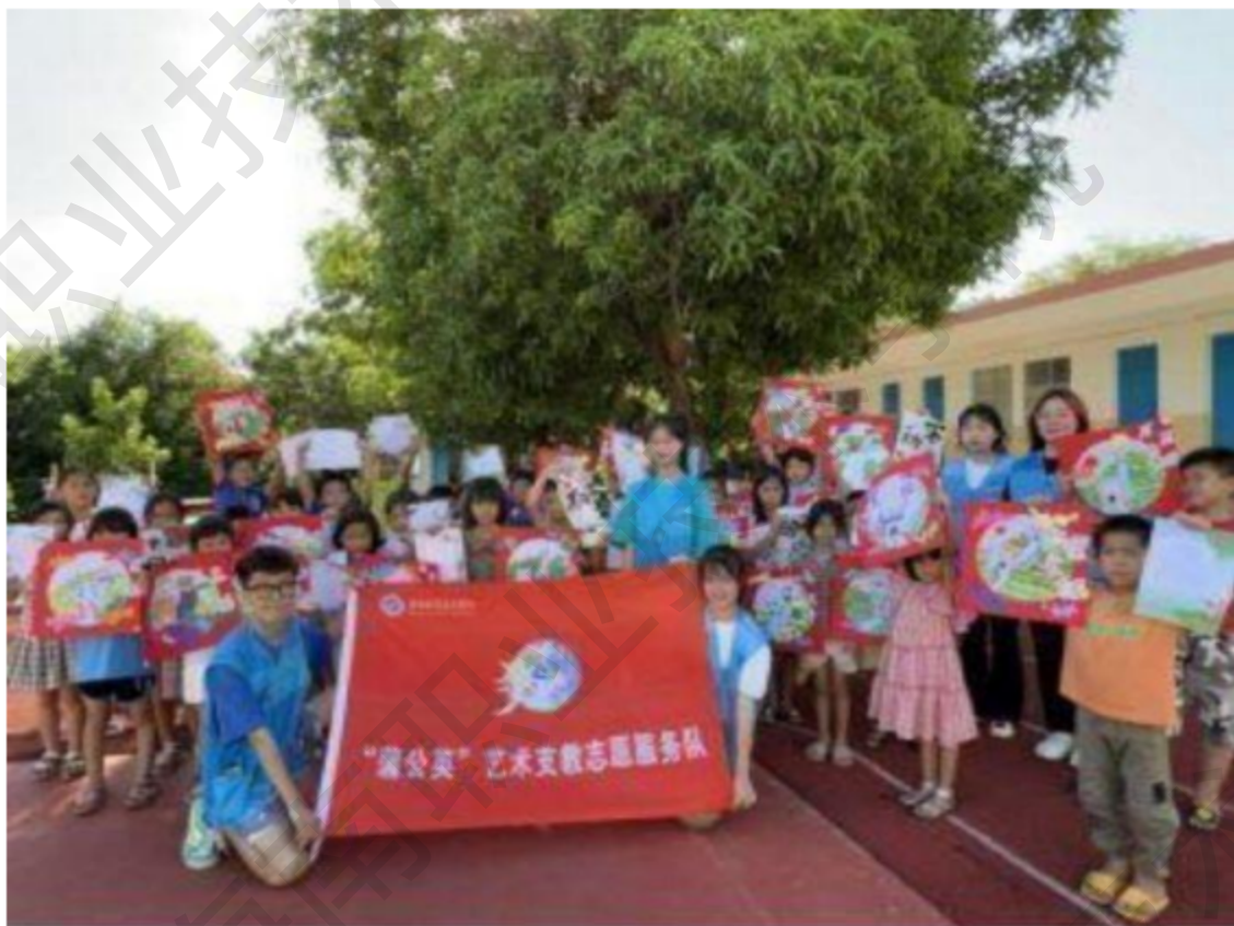
图 1-14 海南职业技术学院“蒲公英”艺术支教志愿服务队

纸砚的历史，懂得了长城的发展，记住了雷锋同志的精神力量，学会了童心向党手势舞，体验到了全民健身的快乐。志愿者与孩子们又一次在艺术中触摸信仰的力量，从文化里汲取前行的力量。今后将坚定不移地紧跟时代召唤，听党话，跟党走，助力海南乡村振兴战略。