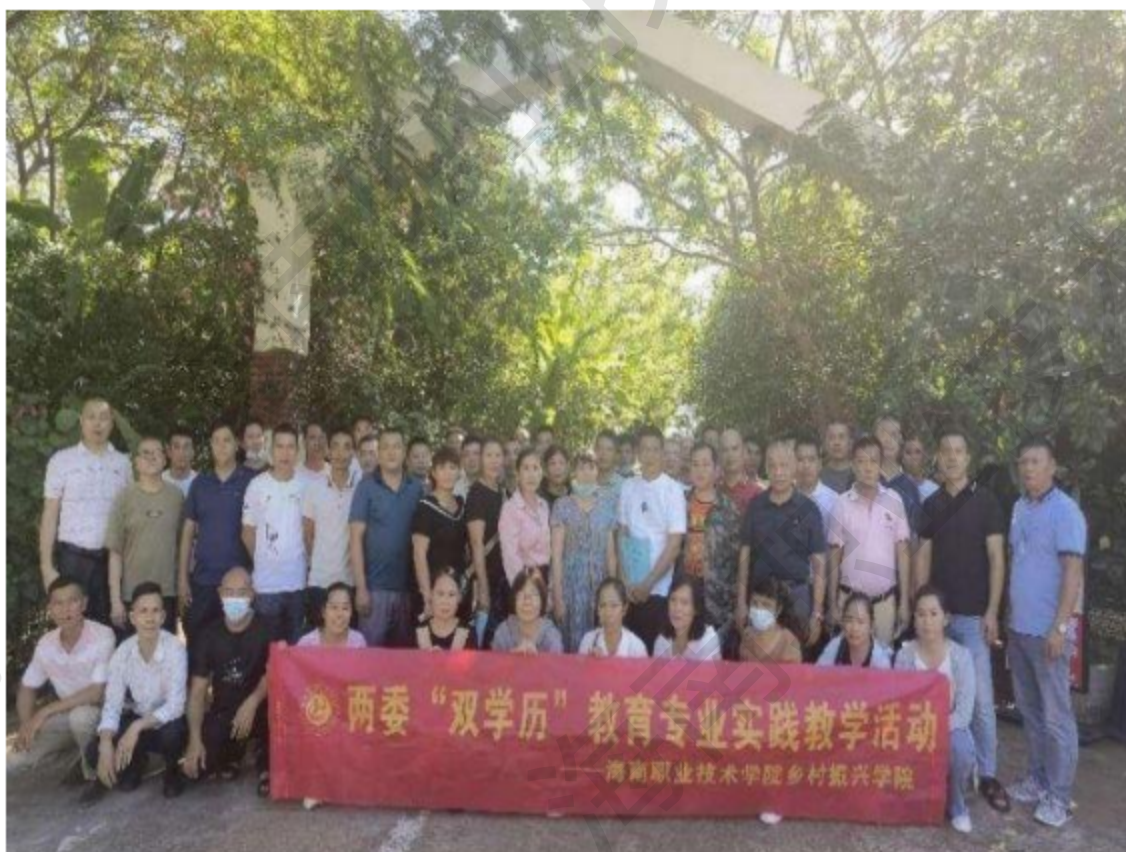
图 5-13 临高东英镇头洋·海堂园林技术专业实践教学活动中