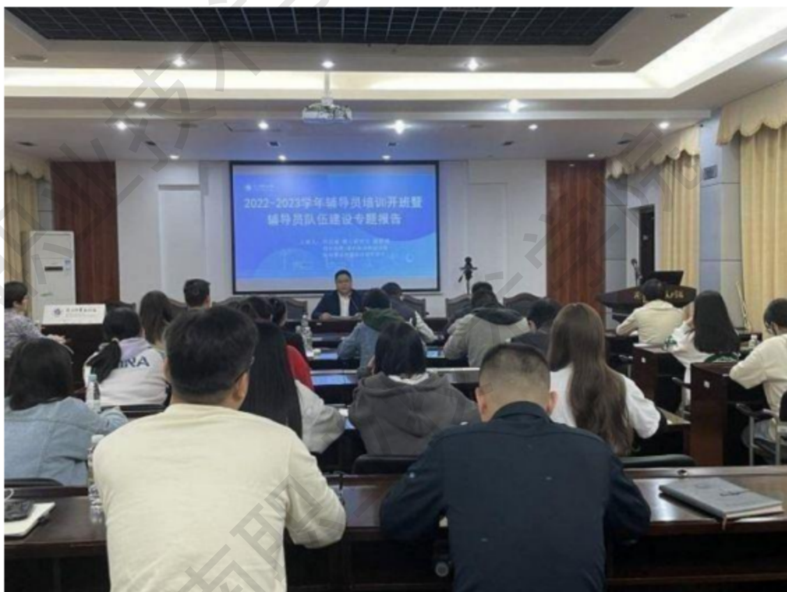
图 1-9 辅导员培训班开班暨辅导员队伍建设专题报告

辅导员专题网络培训等方面提升辅导员队伍的素质能力。已连续执行 5 年，效果显著。目前学校已重点建设和培育 3 个校级辅导员工作室和 1 个名班主任工作室，多名辅导员获得省级辅导员比赛荣誉，多名辅导员获得省级课题立项。