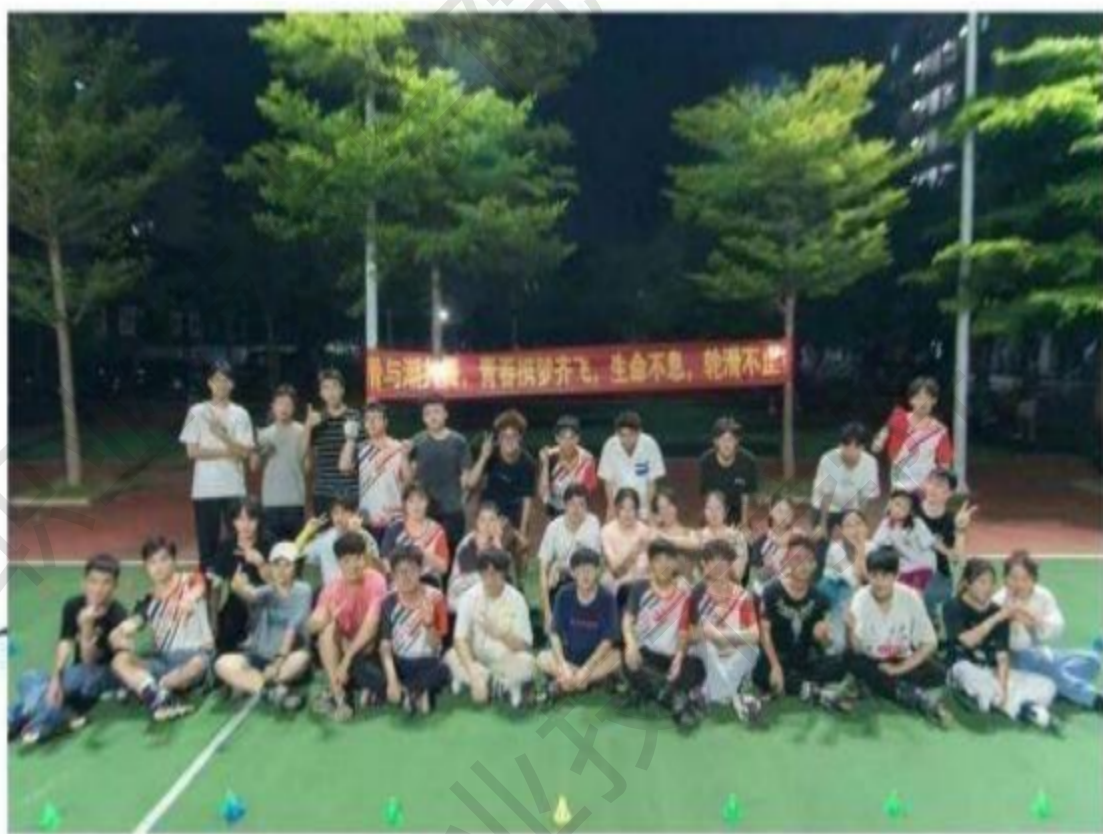
图 1-10 轮滑社团活动