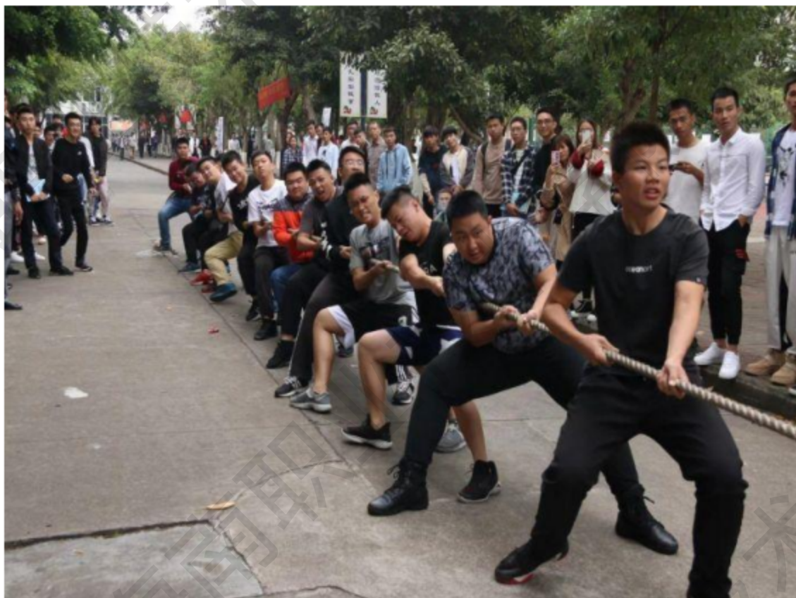
图 1-12 宿舍文化节之拔河活动

选拔担任副楼长，2名楼管员配合完成宿舍管理工作的新模式，大大提高了宿舍管理的效率和能力，提升了生活区服务质量。在秋季学校返校后，按照上级部门和学校的疫情防控要求，顺利推进生活区网格化管理，保障了学生，尤其是新生入校后的生活、学习和核酸检测需求，维护了校园安全稳定。