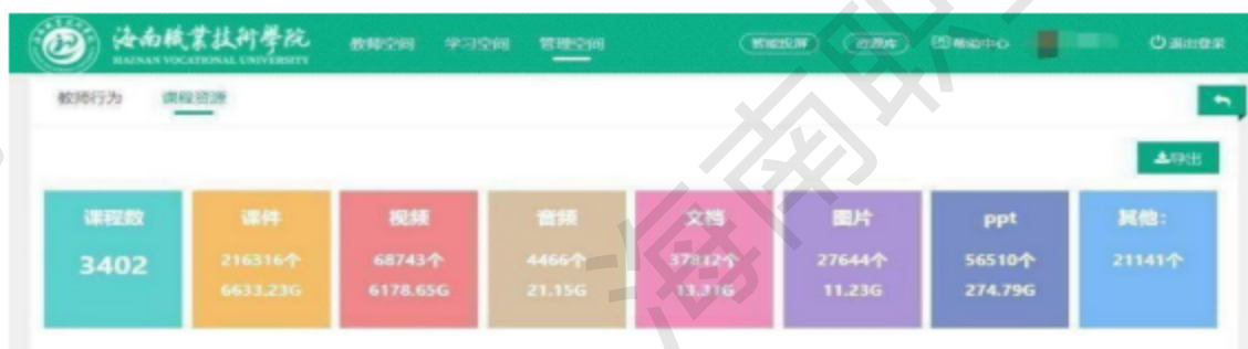
图 2-2 学校在智慧职教平台课程资源情况