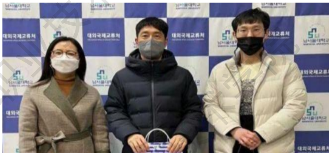
图 3-2 海南职业技术学院赴韩国南首尔大学开展合作洽谈

问了韩国东新大学、韩国南首尔大学、韩国湖西大学等三所院校，就国际教育、国际合作交流等项目开展了洽谈，对双方联合开展夏令营、冬令营项目、2+1+2 本科项目、海职院语言培训中心项目和国际学生实习项目等重要议题都达成了良好的合作意向。