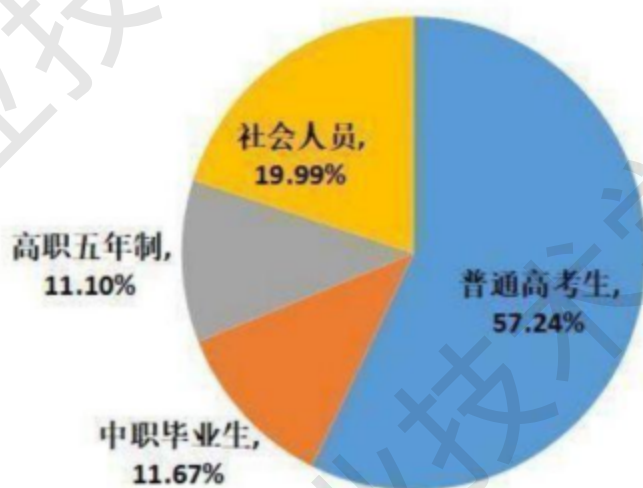
图 6-1 学校 2022 年四大类生源结构比例