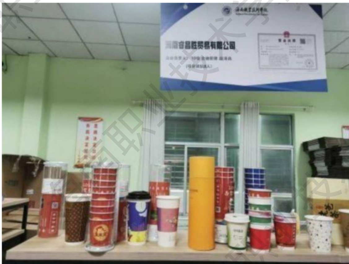
图 1-17 南海杯中茶产品展示图

项目产品“南海杯中茶”已获得诸多企业认同和认购，目前已与多家企业建立合作关系。景泰县嘉泰农产品合作社、海南农村信用社、奥创集团、海南启力有限公司、海南罗牛山集团等，多家公司已经提出复购意愿。