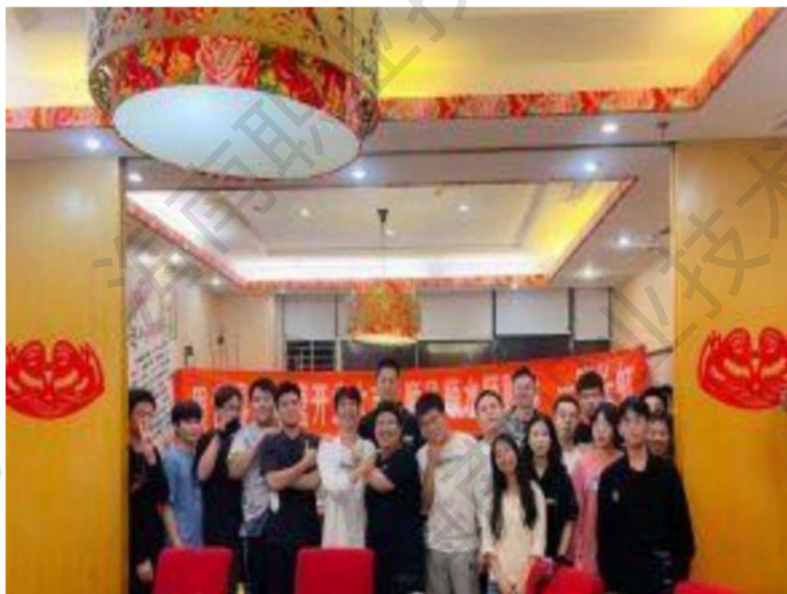
图 1-18 桔唐文化传媒工作室团队合影

生为主体的创业团队于 2021 年 12 月 24 日成功创建，即海南桔唐文化传媒有限责任公司。主营业务以影视后期制作、视频拍摄、平面设计、活动策划与宣传，从媒体内容创新制作到媒体衍生市场开发，以“质量最好”“效率最高”“价格最低”为公司发展理念。团队以视频剪辑为起点，本校师生群体为基础先抢占本校的市场资源，再以利用手中资源将业务拓展到社会团体，利用“年轻人”和设计产品质量高打造品牌优势。亲切、开放、严谨的公司文化和科学规范的管理，凝聚着大量的优秀人才，形成针对政府、企业、个人等不同行业。不同规模、不同应用的针对性解决方案的模式。海南桔唐文化传媒有限责任公司是一家专门针对为校园及社会团体发展运营的大学生传媒工作室。