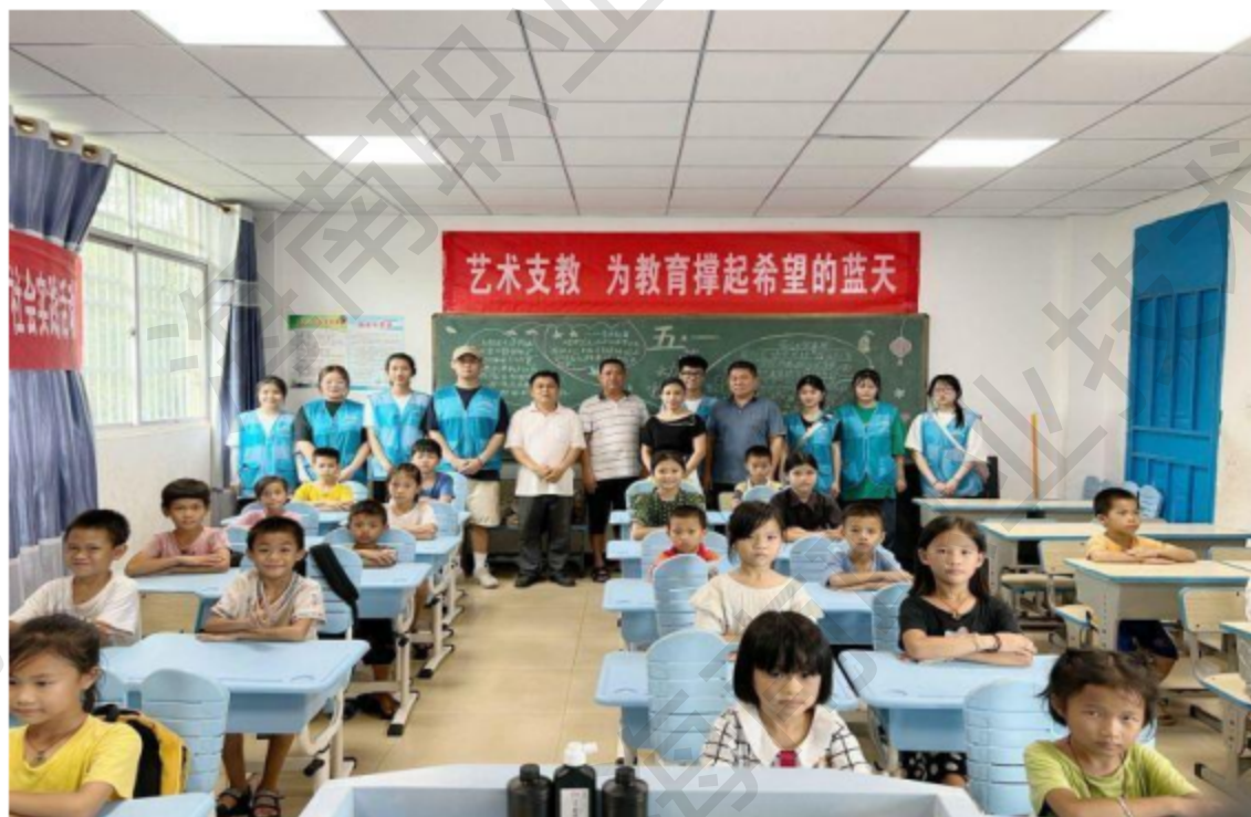
图 4-6 支教合影

东方市板桥镇新园村作为海南职业技术学院扶贫工作点，由于长期受传统应试教育的影响，当前新园小学依然将美术、音乐、手工、舞蹈等艺术课程视为“杂课”，在教室墙上张贴的课表中看不懂艺术课的影子，在校党委、院党总支的指导下组建“蒲公英”艺术支教志愿服务队，根据当地实际需求制定以艺术支教为主要内容的活动方案，为新园小学孩子们开展多彩、新奇、丰富的艺术支教活动，“蒲公英”一直致力于在基层党建的引领下以艺术支教为载体，将红色基因和传统文化润物细无声地根植于新园小学的孩子们的心间，活动一直也受到当地和社会各界的关注与好评。“蒲公英”将不忘初心，继续前行在党建引领下助力乡村文化振兴。