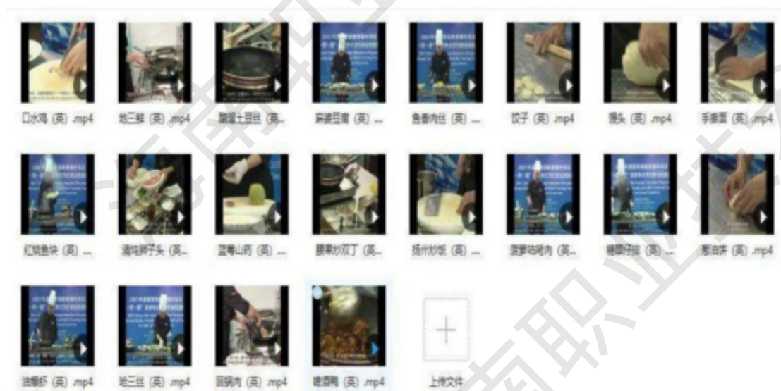
图 3-3 中式烹饪职业技能培养项目教学课程包

借鉴学徒制课程开发经验，深入开发国际性课程标准。结合学校实际，借力 2022 年教育援外项目，推动高质量、有特色、国际化的中式烹饪职业技能培养项目课程标准体系的建设，完成教学课程包拍摄、字幕翻译、英文配音和后期剪辑等，完成制作 20 道传统中式菜肴制作视频。主要内容包含了“中华饮食概述，中华传统拜师仪式，“大师的菜”菜品介绍与展示，中式烹饪功夫展示与介绍（刀功、手功、火功、炒功），中国十大名菜菜品加工与制作，中华传统节日与美食，中华美食与养生，常用中式烹饪汉语（工具、用具、原材料、调味品），中式餐饮用餐礼仪与文化”等。