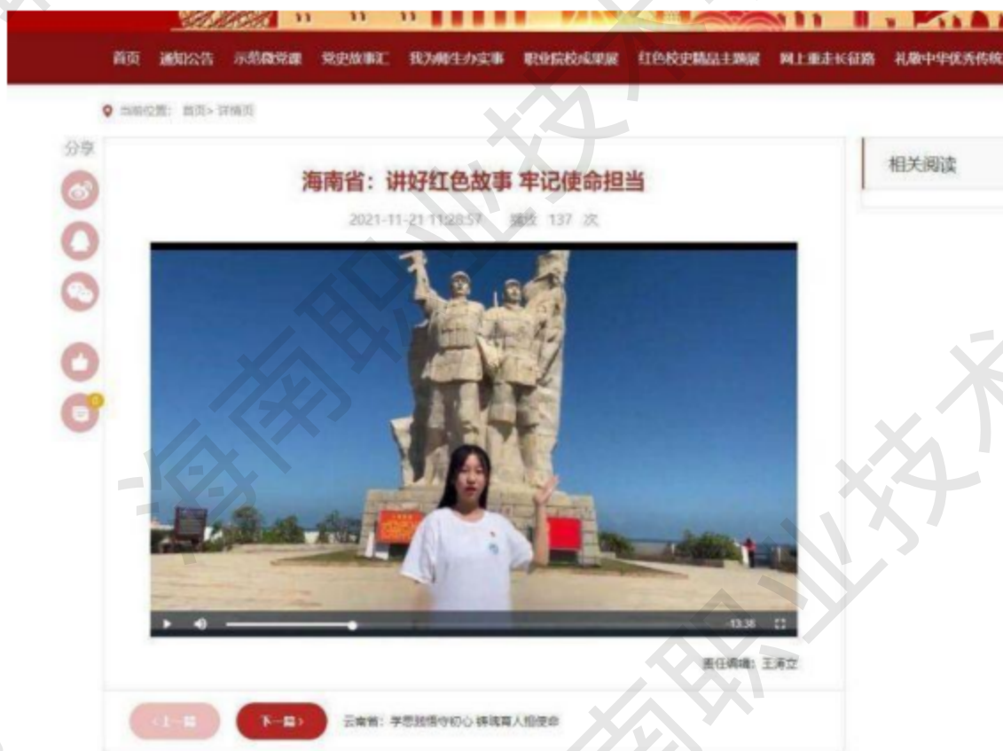
图 1-6 朋辈工作室网络视频在全国高校思想政治工作网展示推广

课“团学干部开讲啦”之“缅怀革命先烈，继承红色精神”主题视频，入选海南省职业院校党史学习教育成果展示视频，并在全国高校思想政治工作网展示推广。拍摄《万泉河水清又清》MV荣获“百城百校百万师生喜迎建党100周年红歌接力活动”一等奖。拍摄建党百年快闪MV和反映学校师生党员风采的《我把青春献给党》宣传片，以青春之声向党献礼。创作歌曲《再唱万泉河》被海南省音协推荐选送到中国音协“建党百年——百年百首原创歌曲”评选活动，并被省教育厅立项为“2022年度海南省高校原创文化精品推广行动计划项目”。