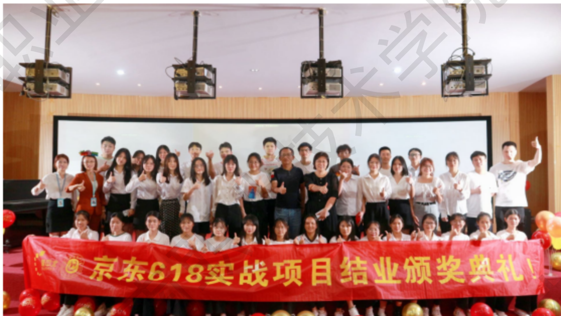
图 2-7 校企合作携手开启 618 岗位实战项目

为提升专业学生对电子商务行业的认知，提升专业学生对电子商务岗位技能提升，日前，海南职业技术学院经济管理学院与海南新中北科技有限公司共同举行“618”岗位实战项目。