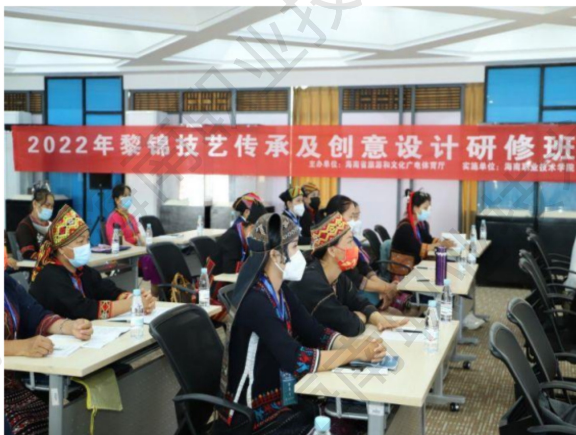
图 4-3 开展 2022 年黎锦技艺传承及创意设计研修班

指尖传承，探索传统技艺发展新模式。2022 年，学校承接了《中国非遗传承人研培计划 2022 年黎锦技艺传承及创意设计研修班》，为本项目学校师资团队设计开发了《黎锦饰品在室内陈设中的创新设计及搭配技巧》《黎族单面绣技艺与实践》《黎锦——从文化遗产到文化市场的转化》等 6 门专题课程，并量身打造了“分组培训、传承人一对一教学、产品设计、模特走秀、学员画册”等一系列教学方案，得到了海南省旅文厅和广大学员的一致认可，2023 年椰雕项目“非遗研培”计划已被文化部非遗司审核通过。