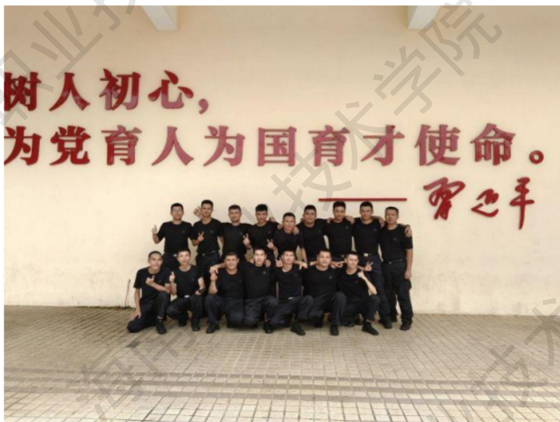
图 4-5 开展 2022 年综合执法点新招辅警岗前培训

自身的表达能力，增强了创新能力，激发了大学生和社会人群学科学、爱科学、用科学的热情。该活动在人工智能科普馆现场教学授课，持续开展，每周进行。“大手牵小手—无限世界”科技志愿者团队获得由团中央青年志愿者行动指导中心，中国青年志愿者协会秘书处，中国科学技术协会宣传文化部共同颁发的 2022 年全国大学生科技志愿服务示范团队。