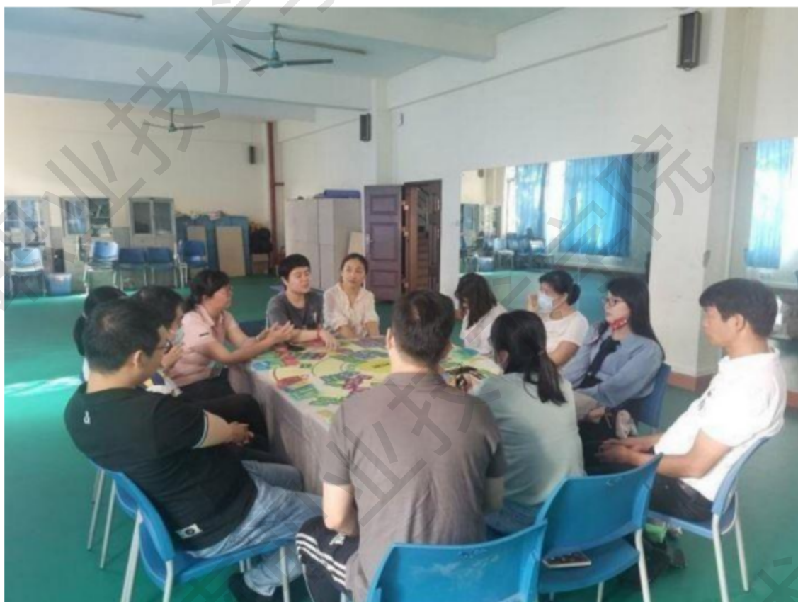
图 1-11 心理健康活动“走心桌游”

灵日志”打卡活动。打卡围绕情绪、人际关系、人际沟通、生涯规划等学生易发生心理问题和冲突的主题，引导学生学会记录、反思和分享，提升自我觉察能力，维护心理健康。2022 年，学校心理咨询中心共接待线上线下来访者约 100 人次。