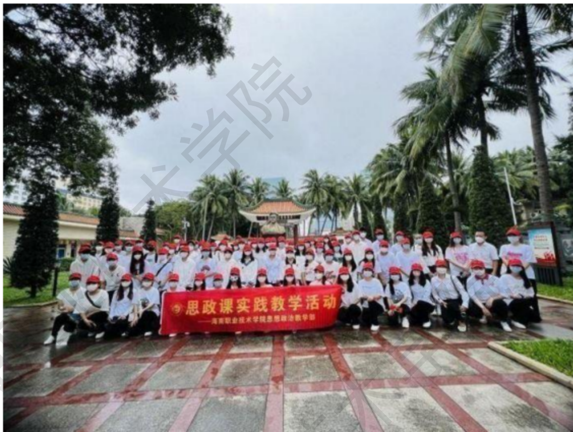
图 1-2 思政课实践教学活动