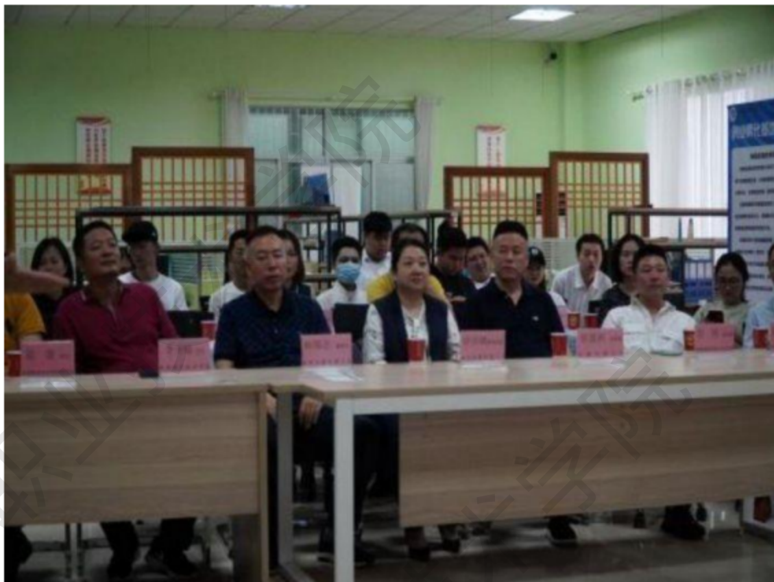
图 1-13 学生创业项目融资路演现场