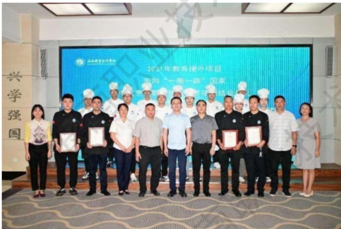
图 3-4 海南职业技术学院面向“一带一路”国家中式烹饪职业技能培训班

手，聘请大师级授课团队，以受援国实际需要为基础，以人才培养为核心，精心制作授课课程包，内容包括 20 道中国传统菜品加工与制作的完整过程教学视频、详细烹饪教学资料等，从菜肴文化、用料搭配到制作过程中刀工的运用、火候的掌握，到最后菜肴的味道、装盘的美化等各个环节，都力求做到精益求精、通俗易懂。学生通过 7 天的理论学习、实践操作等环节了解 20 道中国传统菜品加工与制作的完整过程，从菜肴文化、用料搭配到制作过程中刀工的运用、火候的掌握，到最后菜肴的味道、装盘的美化等各个环节，加深对中国国情、文化和语言的了解，所有学员均顺利获得了项目结业证书。