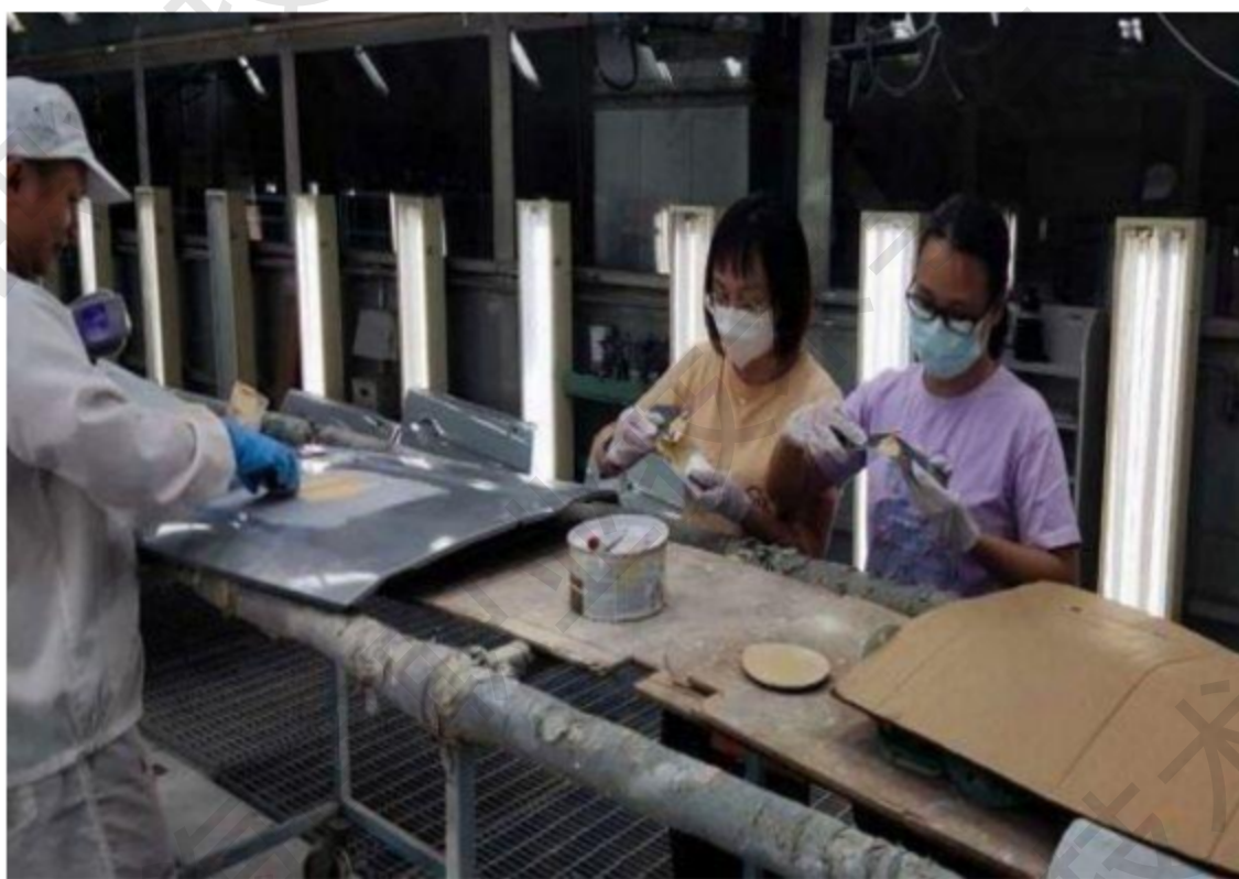
图 2-5 赴海马汽车实践

革、社会服务等方面的能力得到不断提升，通过带领专业群教师进行社会服务，反哺教学能力，增强了师资队伍能力。专业群教师也受聘作为海南海马汽车有限公司外部专家库专家，参与海马相关业务建设，同时为海南海马汽车有限公司员工进行学历提升提供教学帮助，使企业教师在教学能力、科研能力方面有长足的进步。