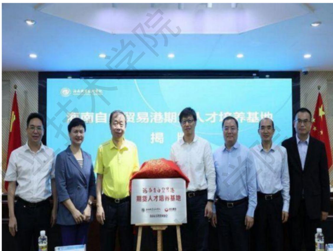
图 2-8 海南自贸港期货人才培养基地揭牌