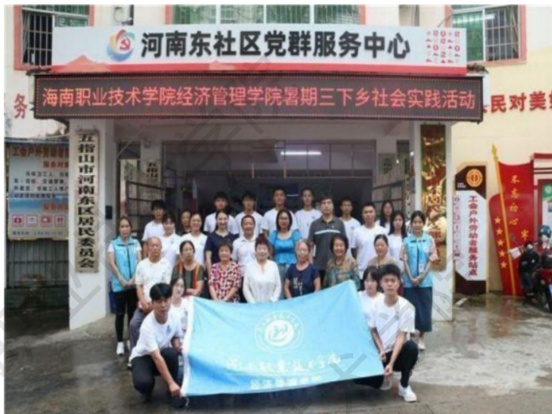
图 4-2 海职院经管学院暑期“三下乡”社会实践团队与参加活动群众合影

本次暑期社会实践活动共发放问卷 300 余份，撰写论文报告 5 篇，覆盖 5 个村镇，影响千余人。得到了五指山河南东社区居委会、五指山社工总站、五指山通什镇红雅什奋村、五指山水满乡毛纳村、琼海嘉积镇椰子寨、定安县母瑞山革命根据地纪念园的大力支持和肯定，希望和学院深入合作多开展此类共建活动，为助力乡村振兴工作提供专业的支持与帮助。同时，让学生们感受到实践的魅力和丰富多样的实践方式，用实际行动深入基层，用心观察、用心思考、学以致用。进一步锻炼了学生的沟通应变能力，让学生们不仅仅是坐在课堂听老师讲，而是迈开腿、张开嘴把自己所学知识传递给更多的人。