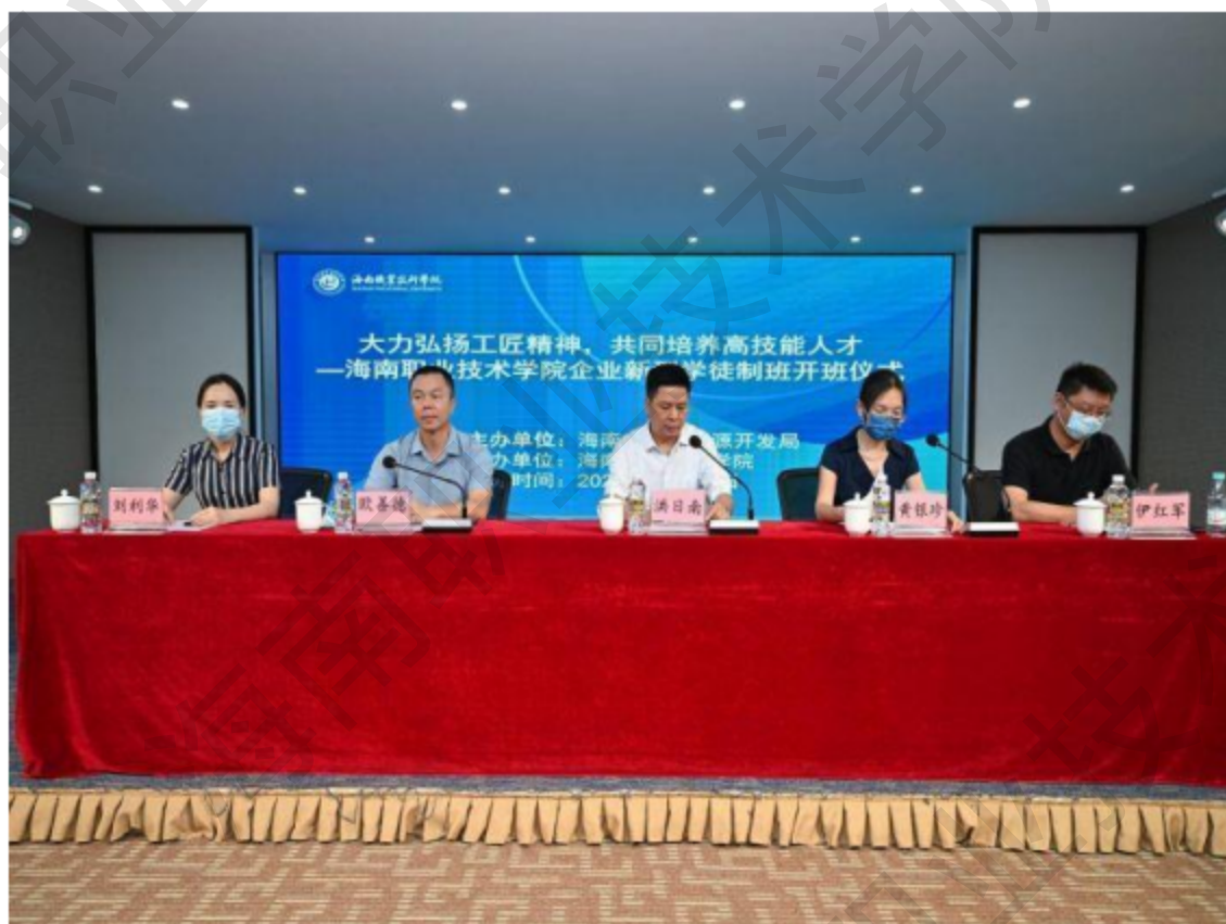
图 4-1 海南职业技术学院企业新型学徒制班

开拓创新，积极开发企业新型学徒制培训项。经过一年多的精心准备，海南职业技术学院企业新型学徒制班于 11 月 30 日正式开班，本次培训涉及罗牛山集团、皇马假日集团共 569 名企业职工，涵盖 11 个职业工种，项目预计收入约 150 万元。