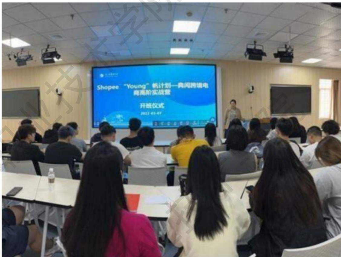
图 2-1 实战营开班仪式

为提升学生专业技能，让学生接触到跨境电商真实店铺的真实业务操作流程，海南职业技术学院经济管理学院与湖南典阅教育科技有限公司联合开展 Shopee “Young 帆计划” 典阅跨境电商高阶实战营项目。该项目于 2022 年 3 月 7 日，在海南职业技术学院一教 209 沉浸式教室举行了开班仪式，海南职业技术学院经济管理学院院长王桃、跨境电商专业专任教师、20 级跨境电商班全体同学参加了活动。开班仪式后，学生们在海南职业技术学院实训楼 305 开始了为期 1 个月的跨境电商高阶实战营项目训练。