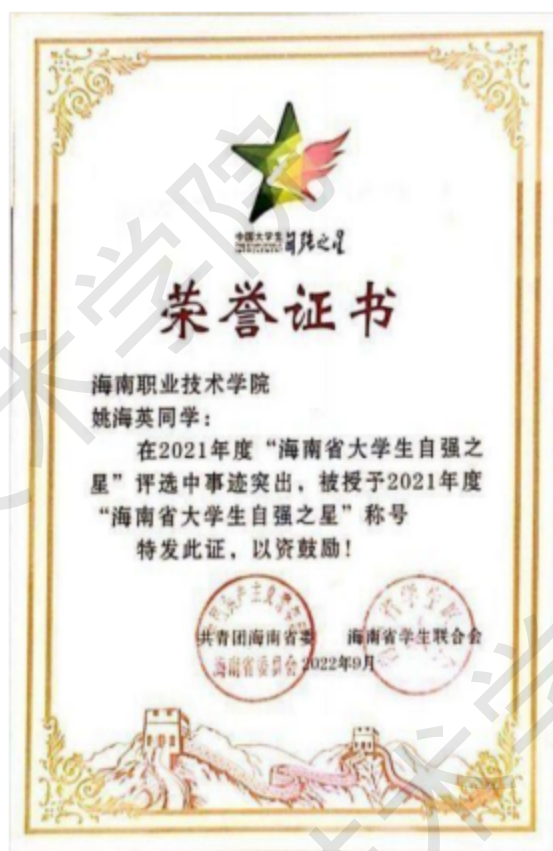
图 1-8 姚海英同学获评 2021 年度海南省大学生自强之星