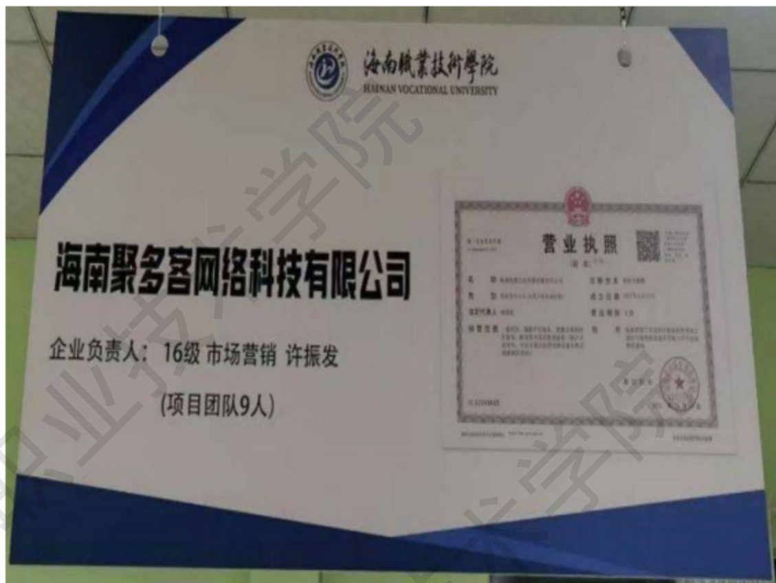
图 1-19 海南居多客团队铭牌