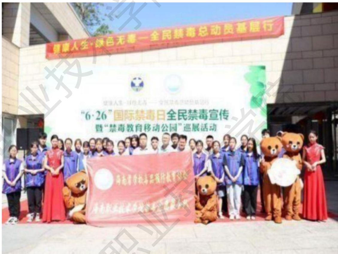
图 1-16 学生志愿者进社区宣传禁毒防艾

2020 年，该项目荣获海南省志愿服务项目大赛《禁毒防艾绿色环岛行》省赛银奖，以及第五届中国青年志愿服务项目大赛《禁毒防艾绿色环岛行》国赛银奖等荣誉。