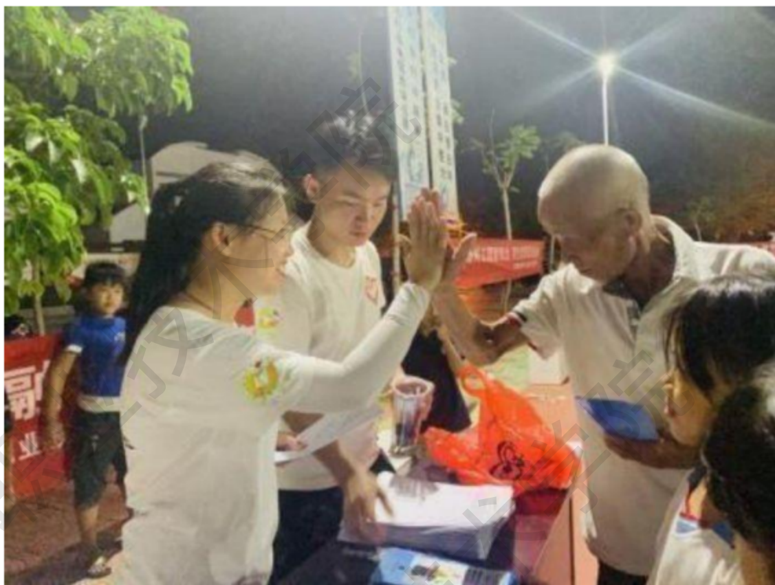
图 1-15 学生志愿者走访农村设点