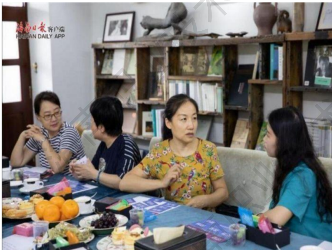
图 1-7 学校心理咨询团队自主研发“从心出发”卡片咨询辅导

将《心理健康教育》《职业生涯规划》整合重构，形成特色校本课程《幸福职业人》，结合该课程，面向全体大一新生开设第二课堂“心灵日志”打卡活动。以情感教育为核心，持续开展“5·25”心理健康月系列特色活动，完成 2000 余名大一新生的心理普查工作，心理咨询中心接待线上线下来访者 100 余人。心理咨询团队结合“非暴力沟通”理论，将自主研发的“从心出发”卡片运用在个体咨询和团体辅导中，帮助学生快速疏导情绪和满足需求，大大提升了咨询效率和咨询效果，获得学生一致好评。