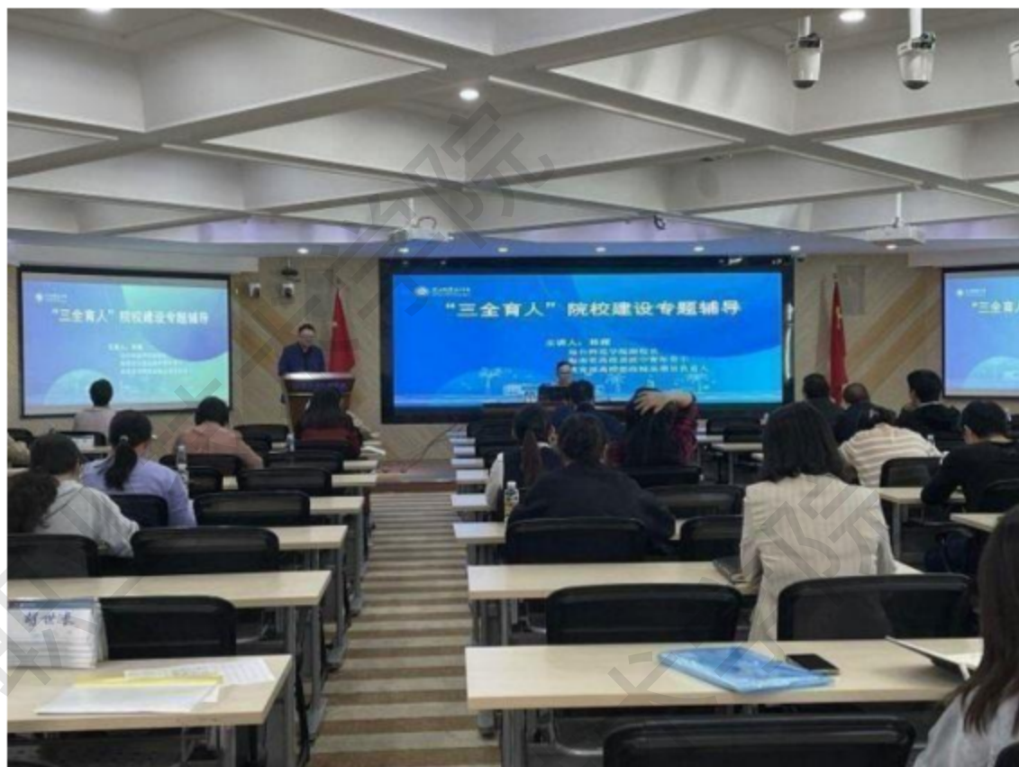
图 1-1 学校“三全育人”建设专题辅导讲座