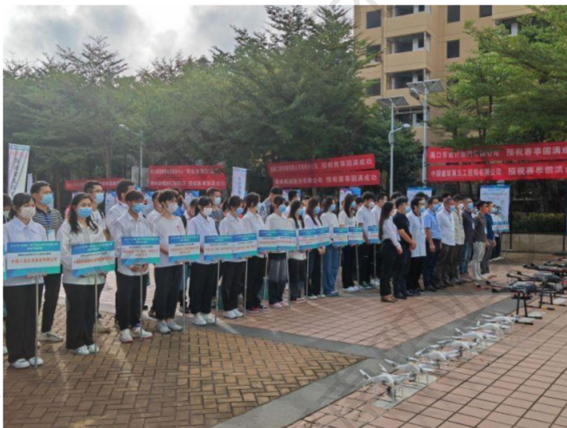
图 4-4 全国职工数字化应用技术技能大赛海南省选拔赛

海南职业技术学院 2022 年首次承接了《全国职工数字化应用技术技能大赛海南省选拔赛》，本次选拔赛以“提升数字技能，更好发挥主力军作用”为主题，设建筑信息模型（BIM）、无人机操作员 2 个赛项，来自省内 21 家企事业单位的 52 名在职一线员工参赛。