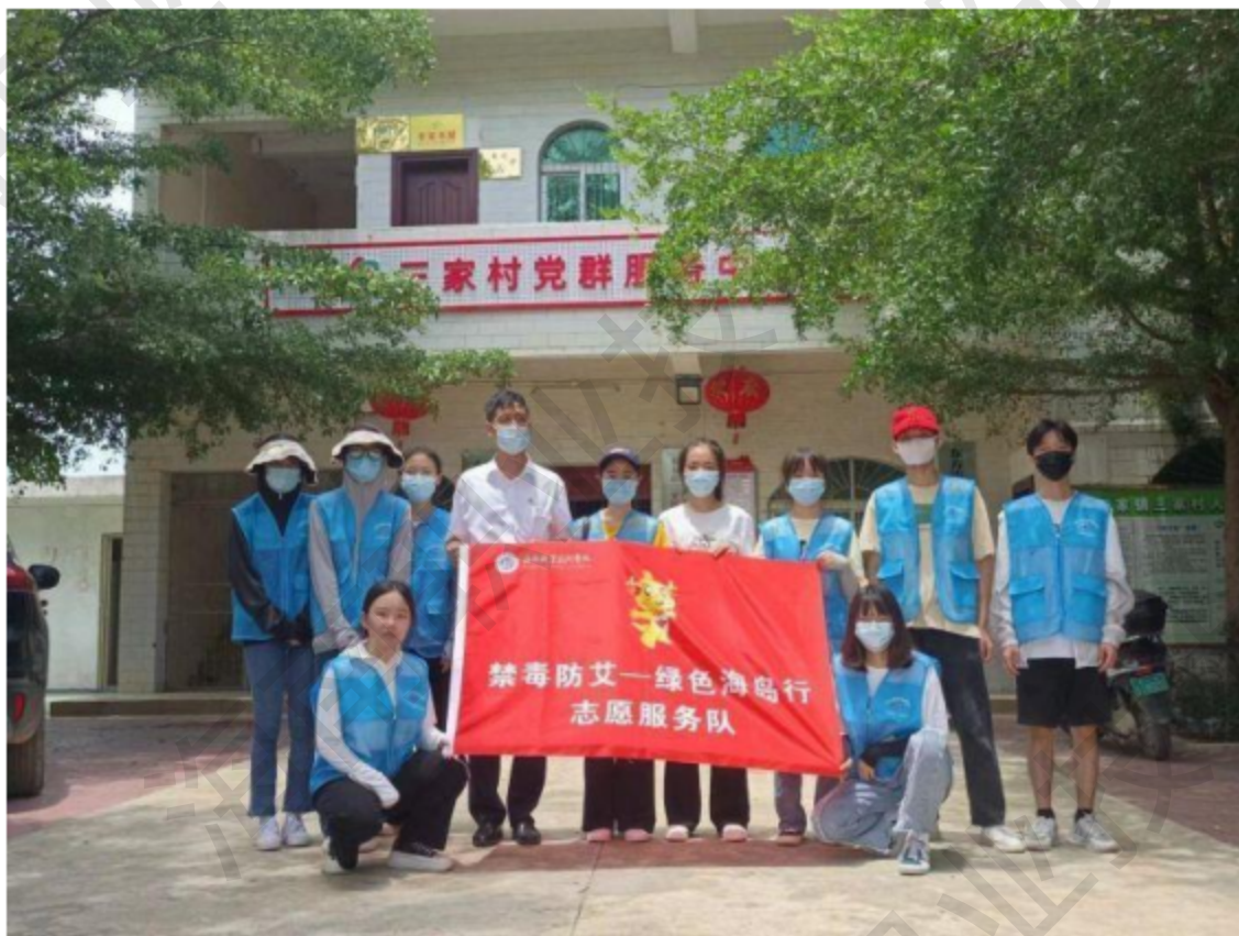
图 1-5 禁毒防艾—绿色海岛行志愿服务

艾绿色环岛行——助力乡村振兴、“小金椰”金融知识普及、义工旅游、“小动保”——宠爱之旅等志愿服务队，专注专业志愿服务品牌化建设。贯彻“五育并举”理念，依托劳动教育课，开展海南职业技术学院第二届劳动文化节，举办劳动成果展，评选一批优秀师生志愿者和最美劳动者，展出一批优秀实践劳动作品和最美劳动瞬间摄影作品，引导学生崇尚劳动、尊重劳动、积极参与劳动。